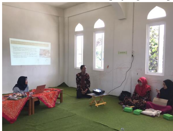
Gambar 1. Pelaksanaan Kegiatan Psikoedukasi “Kesiapan Anak Masuk Sekolah”

Kegiatan pengabdian kepada masyarakat dilaksanakan pada tanggal 22 November 2021 di PAUD Seribu Kubah Tulungagung. PAUD Seribu Kubah tepatnya di desa/kelurahan Sukowidodo, kecamatan Karangrejo kabupaten Tulungagung Jawa Timur. Peserta pada kegiatan ini terdiri dari orangtua siswa sekolah PAUD Seribu Kubah Tulungagung. Kegiatan ini sebelumnya sudah melakukan penggalian data awal bahwasannya orang tua siswa dan guru PAUD Seribu Kubah Tulungagung membutuhkan psikoedukasi kesiapan anak masuk sekolah. Materi pada kegiatan ini disampaikan melalui media ceramah dan powerpoint, sehingga masyarakat dapat lebih mudah memahami apa yang disampaikan oleh pemateri.