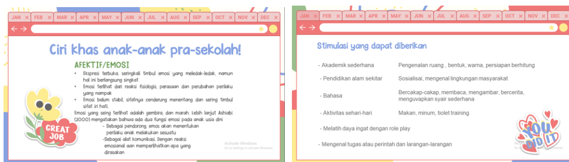
Gambar 3. Materi Psikoedukasi “Kesiapan Anak Masuk Sekolah”

Adapun penilaian di Kelompok Bermain dilaksanakan berdasarkan gambaran/deskripsi pertumbuhan dan perkembangan, serta unjuk kerja peserta didik yang diperoleh dengan menggunakan berbagai teknik penilaian. Dalam kegiatan pembelajaran sehari-hari, penggunaan berbagai teknik penilaian ini terintegrasi dengan kegiatan pembelajaran itu sendiri, sehingga guru tidak harus menggunakan instrument khusus. Untuk anak-anak yang menunjukkan perkembangan dan perilaku yang khas, dan memerlukan penanganan secara khusus diperlukan instrument yang khusus pula seperti disajikan dalam lampiran pedoman. Beberapa teknik penilaian yang dapat dilakukan di Kelompok Bermain, diantaranya: