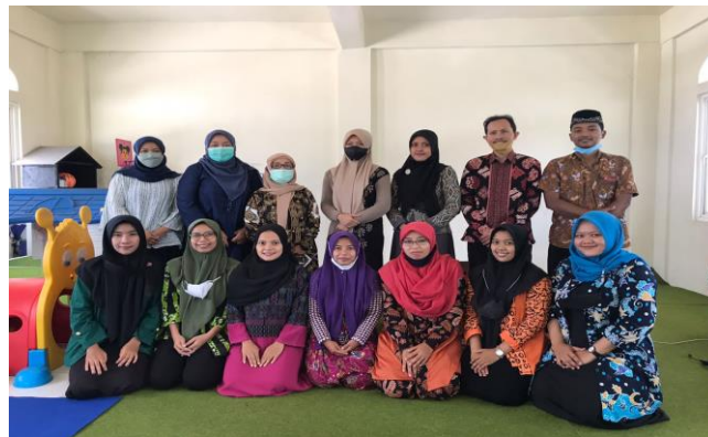
Gambar 2. Kegiatan setelah selesai diskusi Psikoedukasi

Kegiatan pengabdian kepada masyarakat ini memiliki respon yang baik dari orang tua siswa PAUD Seribu Kubah. Hal ini dibuktikan dengan adanya antusiasme peserta untuk bertanya serta menjawab pertanyaan yang diajukan oleh narasumber. Pelaksanaan kegiatan pengabdian kepada masyarakat ini diharapkan dapat menambah pengetahuan serta pemahaman terkait anak secara utuh terhadap orangtua siswa PAUD Seribu Kubah. Saat kegiatan berlangsung, peserta juga diajak narasumber untuk memahami anak-anak secara utuh dari berbagai metode yang diberikan dengan menyesuaikan pada tahap perkembangan anak melalui video, ceramah, dan juga terlibat dalam proses edukasi yang diberikan.