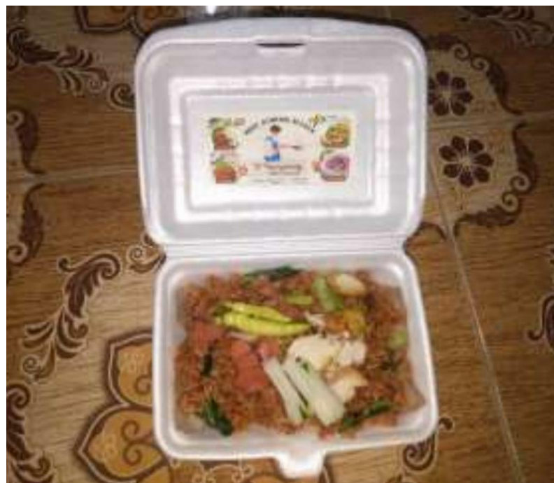
Gambar 5: Pengimplementasian salah satu label produk UMKM Desa Bukur

Sebagian dari pelaku UMKM yang ada di Desa bukur, belum memahami lebih jauh terkait pentingnya proses labeling pada setiap produk. Juga terdapat beberapa kendala seperti keterbatasan biaya dan waktu. Sehingga masih banyak yang belum memberikan label pada produk hasil UMKM-nya. Oleh karena itu, mahasiswa KKN IAIN Kediri berupaya membantu para pelaku UMKM terkait dengan cara pembuatan label produk pada produk usaha mereka. Ada sekitar 10 label produk UMKM yang pembuatannya dibantu oleh mahasiswa KKN IAIN Kediri. Baik itu berupa produk makanan maupun minuman seperti, kerupuk, tape, kopi, nasi goreng, mi goreng, kwetiau goreng, mie ayam, es buah, es tebu, dan sempol ayam. Gambar di atas merupakan salah satu bentuk label produk UMKM Desa Bukur yang pembuatannya dibantu oleh mahasiswa IAIN Kediri.