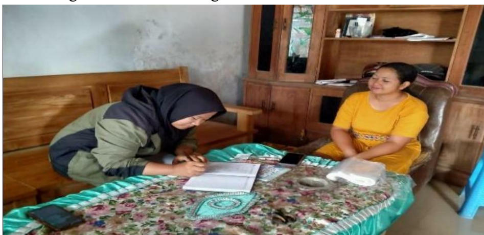
Gambar 3: Pendataan produk dan Pendampingan PPH

Kegiatan ini telah menghasilkan perkembangan yang cukup signifikan dari sektor UMKM di Desa Bukur ini. Dari hasil kegiatan yang dilaksanakan, terdapat 11 pelaku usaha yang mendapatkan sosialisasi self-declare , sebanyak 10 UMKM dan 15 produk dapat memenuhi syarat untuk memasuki tahap selanjutnya yaitu tahap pengajuan persyaratan data produk yang sesuai dengan klasifikasi lembaga.