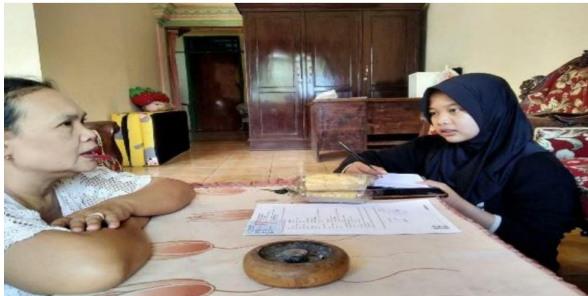
Gambar 4: Konsultasi PPH