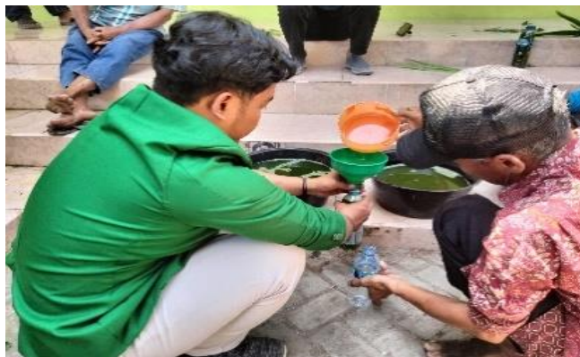
Gambar 1. Kegiatan Pelatihan dan Pembuatan Biosaka

Selanjutnya proses pembuatannya dilakukan dengan cara meremas dedaunan atau rerumputan di dalam air kurang lebih 5 liter dengan durasi kurang lebih selama 15-20 menit. Biosaka boleh tidak digunakan secara langsung atau dalam hal ini disimpan terlebih dahulu, asalkan warnanya tetap homogen (warna tidak berubah), biasanya 3 hari mengalami kecoklatan atau tidak kembali ke warna asal. Biosaka ini boleh dicampur dengan pestisida lainnya, biasanya digunakan untuk mencegah datangnya ulat di tanaman. Manfaat dari penggunaan Biosaka bukan untuk meningkatkan nutrisi tetapi mengembalikan apa yang seharusnya ada di dalam tanaman itu.