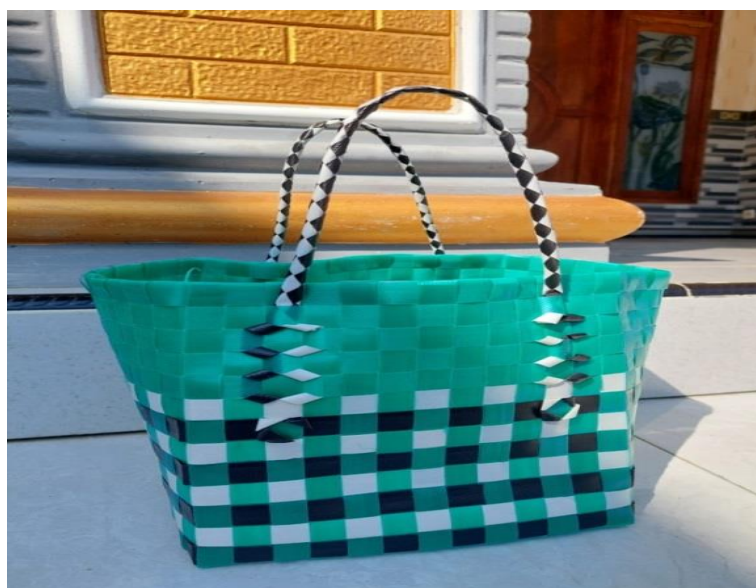
Gambar 2. Contoh tas anyaman berbahan dasar embos

Pelatihan ini dilakukan dengan harapan keterampilan yang dimiliki warga Desa Brumbung bisa berkembang dalam menganyam dimana dengan keterampilan tersebut warga mampu memanfaatkannya untuk membuka usaha yang dimulai dengan memperjual belikan tas anyaman. Selain itu, pelatihan ini juga mempunyai sebuah tujuan agar para warga Desa Brumbung lainnya agar memiliki ketertarikan untuk berbisnis di bidang kerajinan tangan tas anyaman ini. Disisi lain, dengan diadakannya pelatihan ini juga berdampak pada perubahan perilaku dan pola pikir warga Brumbung untuk lebih berani berinovasi dan mampu berkompetensi di bidang kewirausahaan.