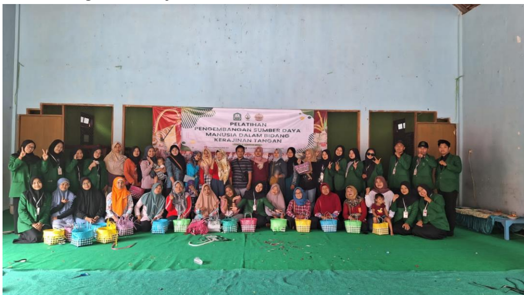
Gambar 4. Dokumentasi Kegiatan Pelatihan mengolah Tas Anyaman

Dari dua bahan dasar tas tersebut ternyata memiliki keunggulan antara lain tidak mudah pecah, memiliki tingkat kekuatan dan kekerasan yang tinggi, daya tahan baik, sifatnya ringan, tahan terhadap bakteri dan jamur, tidak cepat rusak dan ramah lingkungan. Namun di sisi lain tas yang berbahan embos harganya relatif lebih murah daripada tas yang berbahan dasar jali karena tingkat kualitas bahannya juga berbeda. Embos cenderung lebih tipis dan mudah terurai sedangkan bahan jali lebih tebal dan kuat.