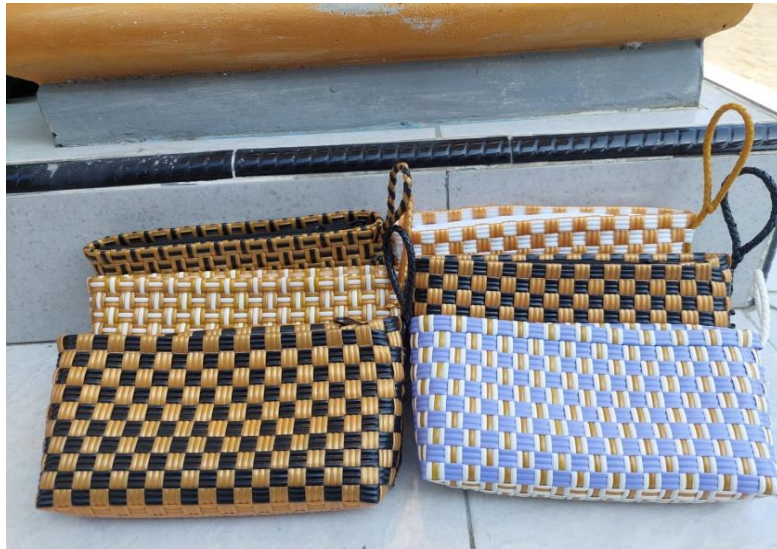
Gambar 3. Contoh tas anyaman berbahan dasar jali

Bahan yang biasa digunakan oleh para pengrajin tas anyaman di Desa Brumbung masih seputar bahan jali dan embos. Namun dari dua bahan dasar tersebut, para pengrajin mampu menciptakan berbagai model yang bervariasi baik berupa tas, dompet dan lain sebagainya. Variasi tersebut dilakukan untuk menarik minat konsumen untuk membeli tas anyaman karena melihat dari banyaknya model yang ada sehingga mereka bisa mengoleksi beberapa model tas hanya dari dua bahan tersebut.