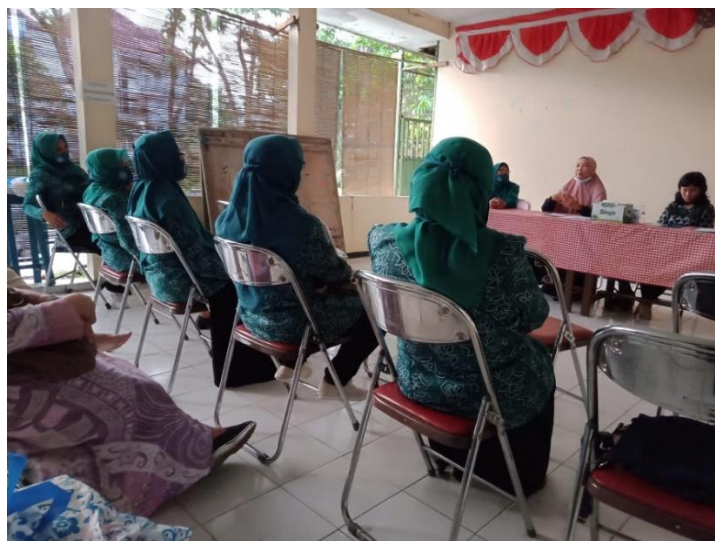
Gambar 1. Penyampaian informasi tentang pentingnya mekanisme Sistem simpan Pinjam Koperasi

Terlibat di dalam kegiatan pengabdian kepada masyarakat tersebut diantaranya dosen-dosen Politeknik dan tim penyuluhan pelatihan pengurus PKK ibu-ibu RW 19 Kelurahan Mojolangu Kecamatan Lowokwaru Kotamadya Malang, khususnya kelompok Kerja II. Tim pelatihan melibatkan pengurus ibu-ibuk PKK di Pokja II dengan tujuan untuk memperlancar sekaligus memberi proses pembelajaran dari mekanisme sistem simpan pinjam koperasi di PKK RW 19 Kelurahan Mojolangu Kecamatan Lowokwaru. Berikut dokumentasi dari pelaksanaan pengabdian masyarakat mekanisme sistem simpan pinjam Koperasi di PKK RW 19 Kelurahan Mojolangu Kecamatan Lowokwaru yang terdiri dari 3 Gambar yaitu: