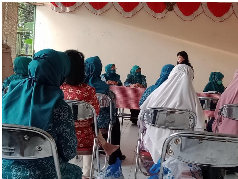
Gambar 3. Diskusi tentang mekanisme sistem simpan pinjam koperasi