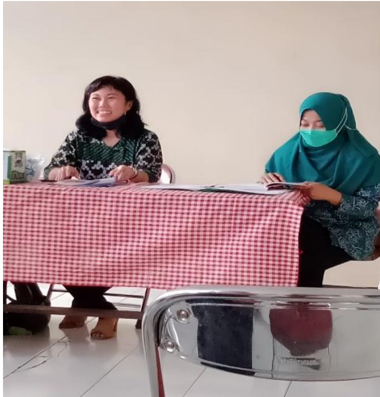
Gambar 2. Penyampaian Materi