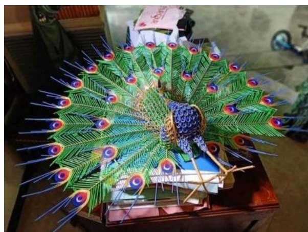
Gambar 2. Hasil Kerajinan masyarakat dari bahan sederhana

Strategi pemberdayaan kedua yaitu dengan pengembangan dan pendampingan UMKM untuk menambah pendapatan rumah tangga. UMKM yang ada di Desa Keling bermacam-macam seperti pia Marwa Bakery, dan krupuk pati, kerajinan tangan dari koran bekas, kerajinan dari buah mojo. Pemberdayaan dapat dilakukan dengan cara pendampingan dan memberikan pemahaman untuk langkah pengembangan dan pemasaran UMKM baik pemasaran offline maupun pemasaran online. Dan nantinya produk UMKM ini dapat dikenal wisatawan dan dapat dijadikan sebagai oleh-oleh bagi wisatawan yang berkunjung.