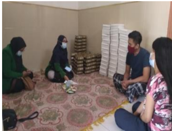
Gambar 1. Sosialisasi Mahasiswa KKN kepada masyarakat

Dampak pengembangan wisata terhadap pemberdayaan ekonomi masyarakat adalah pengembangan daya minat wisata secara langsung maupun tidak langsung yang dapat membuka kesempatan kerja dan usaha jasa wisata yang ada dan nantinya mampu meningkatkan pendapatan masyarakat sekitar (Habib, 2021). Manfaat yang dirasakan masyarakat terhadap pengembangan pariwisata dapat menggugah keterlibatan masyarakat sehingga mereka dapat ikut dan berperan di dalamnya, baik secara aktif maupun pasif. Pengembangan wisata diharapkan memberikan dampak positif terhadap peningkatan perekonomian masyarakat sekitar. Pemerintah desa dan objek wisata harus bisa memberikan peluang kesempatan kerja bagi masyarakat dalam mengembangkan berbagai usaha untuk meningkatkan perekonomian masyarakat serta mendukung pengembangan wisata (Indrianti et al., 2019; Istiyanti, 2020).