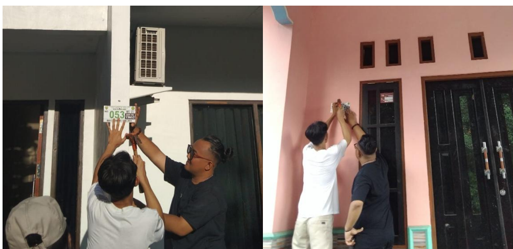
Gambar 2. Pemasangan plat penomoran rumah warga

Pertumbuhan penduduk yang pesat dan perkembangan teknologi informasi telah menjadikan nomor rumah sebagai salah satu elemen penting dalam kehidupan masyarakat. Nomor rumah tidak hanya berfungsi sebagai identitas suatu bangunan, tetapi juga memudahkan berbagai aktivitas sehari-hari, seperti pengiriman barang, layanan darurat, dan pengembangan infrastruktur digital. Sayangnya, masih banyak rumah yang belum dilengkapi dengan nomor rumah, sehingga menghambat upaya pemerintah dalam meningkatkan kualitas pelayanan publik dan kesejahteraan masyarakat (Fajri et al., 2024). Penomoran rumah merupakan upaya untuk meningkatkan kualitas hidup masyarakat dengan cara yang sederhana namun efektif. Dengan adanya nomor rumah, proses pencarian alamat menjadi lebih mudah dan efisien, baik bagi pemilik rumah sendiri maupun bagi pihak luar seperti petugas pos, kurir, atau petugas darurat. Nomor rumah juga memudahkan dalam proses pendataan penduduk dan pelaksanaan berbagai program pembangunan di tingkat lokal (Ramadhan, Firdaus, & Putri, 2024). Nomor rumah tidak hanya sekadar angka, tetapi juga merupakan identitas unik bagi setiap rumah. Keberadaan nomor rumah memperkuat rasa memiliki dan kebanggaan warga terhadap lingkungan tempat tinggalnya. Selain itu, nomor rumah juga mempermudah interaksi sosial antar warga, serta memfasilitasi kegiatan kemasyarakatan yang membutuhkan informasi alamat yang akurat (Patriadi, 2024).