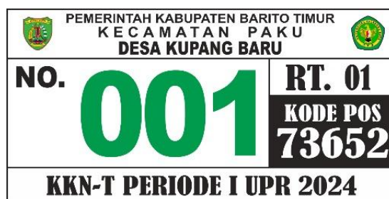
Gambar 1. Desain penomoran rumah

Seiring dengan perkembangan teknologi, terdapat berbagai cara untuk mempermudah setiap kegiatan manusia, hal ini sejalan dengan teori adopsi teknologi yang menjelaskan bagaimana individu dan masyarakat menerima dan menggunakan inovasi baru. Implementasi teknologi pada pembuatan penomoran rumah ini tidak hanya mempercepat proses penomoran itu sendiri, tetapi juga mendorong masyarakat untuk lebih familiar dengan teknologi informasi. Dengan demikian, proses penomoran rumah menjadi lebih efisien dan efektif, serta berkontribusi pada pembentukan smart vilage yang berbasis data spasial yang akurat (Vhania Mutiara Sinaga, 2023).